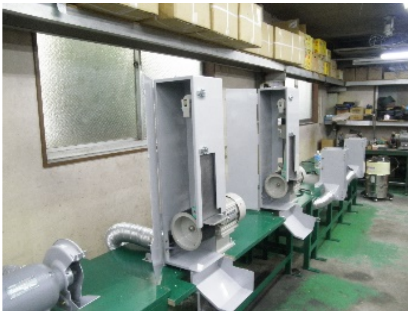
ベルトサンダー(大)