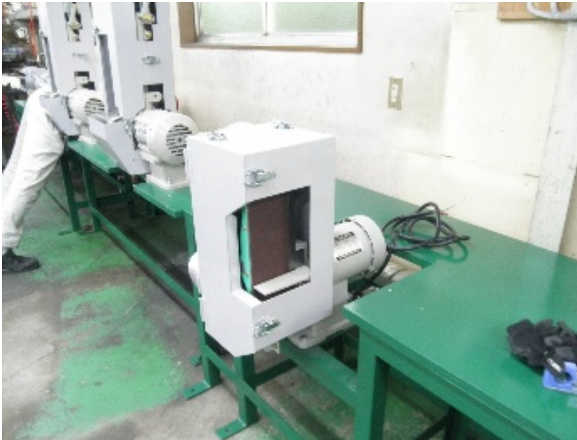
ベルトサンダー(小)