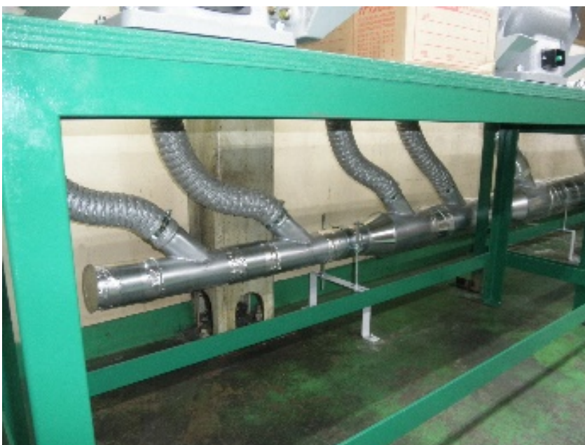
作業台下分岐配管