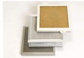
(上から) プレフィルター、準HEPAフィルター、活性炭フィルター