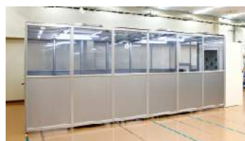
パネル式タイプ、エアシャワー、パスボックス付きタイプ などの対応もできます。