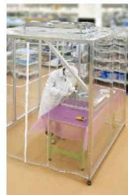
使用例 (クリーンブース)

構成/プレフィルター: 不織布、メインフィルター: HEPA (ULPAにも変更が可能です)、 本体: ステンレス仕様、ファン: DC静音ブロー (NFUZD-01HのみDC軸流ファン 捕集効率/99.97%以上(0.3μm以上の粒子にて) 電源/AC100~240V(50/60Hz)